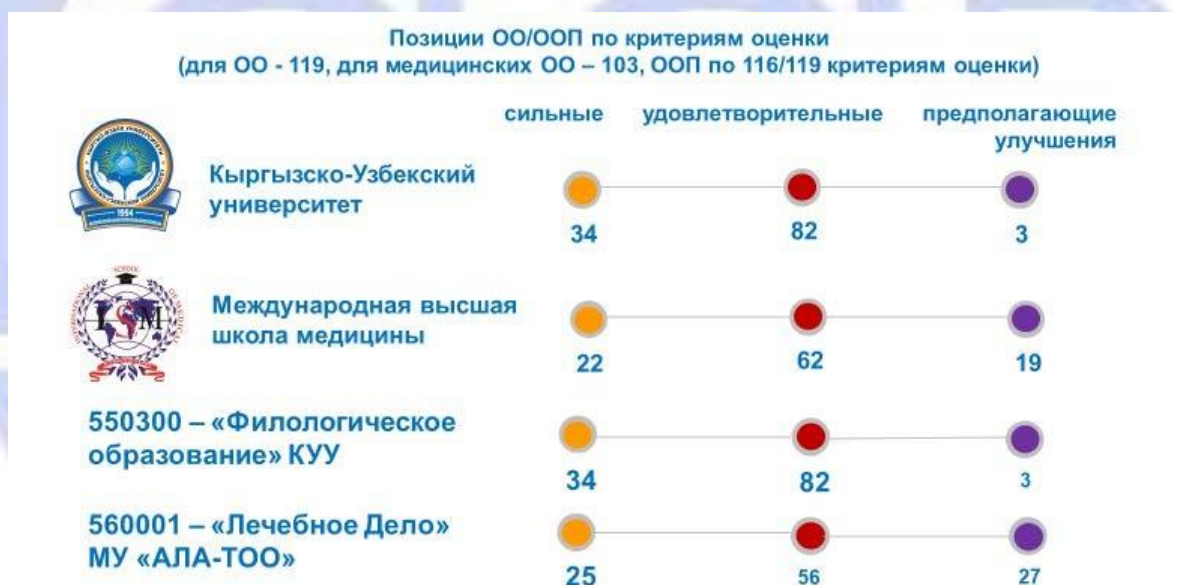
Сурет 1. ББҰ/БББ сапасының институционалдық аккредиттеу стандарттарының критерийлеріне сәйкестік матрицасы.

IAAR ССК БББ стандарттар өлшемшарттарына сәйкестік деңгейлері бойынша қорытындылар дайындады, олардың негіздемесі орындалған аккредиттеу рәсімдерінің қорытындылары бойынша есептерде баяндалған. Білім беру ұйымдары мен негізгі білім беру бағдарламалары сапасының IAAR стандарттарының өлшемшарттарына сәйкестігінің сандық көрсеткіштері 1-суретте көрсетілген.