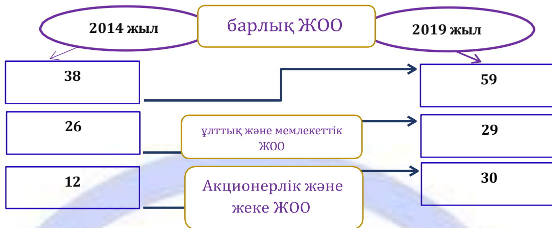
Сурет 2. IAAR рейтингінің объектілері бойынша статистика.

IAAR рейтингі жыл сайын өткізіледі және рейтинг нәтижелері мамыр айында кадрларды даярлау бойынша мемлекеттік тапсырысты жариялау мерзіміне дейін, сондай-ақ ҚР мектептері түлектерінің Ұлттық бірыңғай тестілеуін, ҚР оқушыларының жалпы республикалық тестілеуін тапсыру кезеңі басталғанға дейін жарияланады.